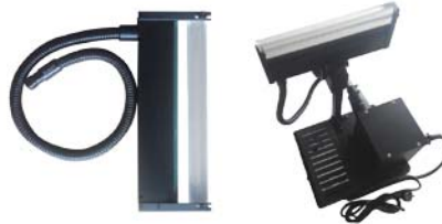
线型白光光源附件